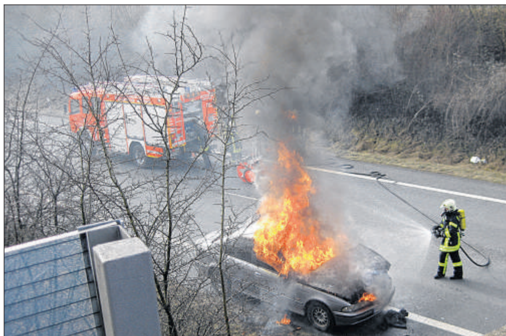
Gerhard Fröhlecke fotografierte den Feuerwehreinsatz von der Fußgängerbrücke Eupener Straße auf die B515 herab.

Die Mendener Feuerwehr ist auf solche Einsätze wie das brennende Auto vorbereitet: „Das passiert immer mal wieder“, so Einsatzleiter Olaf Schürmann.